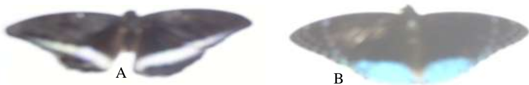
Gambar (Figure) 5. A. Famili Hesperidae (Family of Hesperidae): Tanaecia iapis ; B. Famili Lycaenidae (Family of Lycaenidae): Stibochiona coresia

Di dalam hutan kupu-kupu memegang peranan penting dalam memelihara lingkungan. Kupu-kupu selalu mendatangi bunga berbagai jenis tumbuhan untuk mengambil madu dan serbuk sari bunga. Bentuk, warna, dan aroma bunga dipergunakan sebagai petunjuk adanya nektar bunga yang dipilih serbagai makanannya (Proctor and Yeo, 1957). Nektar