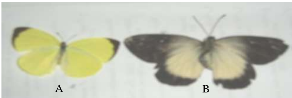
Gambar (Figure) 1. Famili Pieridae (Family of Pieridae): A. Gandaca harina , B. Delias belisama

Kupu-kupu Papilionidae sebagian besar merupakan jenis yang berukuran