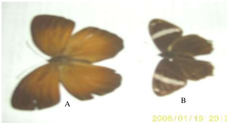
Gambar (Figure) 4. Famili Satyridae (Family of Satyridae): (A) Faunis cenens , (B) Lethe confusa