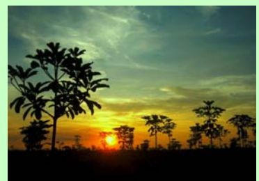
Jelutung muda di ujung Senja oleh Suningsih, S. Hut (BPK Palembang)