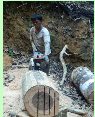
Membelah Log oleh B2PD Samarinda