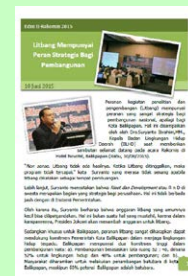
Berita Rakornis Edisi II, 2015