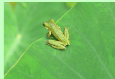
Katak di Cagar Alam Pegunungan Fakfak oleh Gatot Nugroho, BPK Manokwari