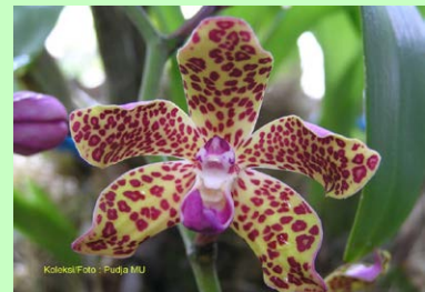
Vandopsis sp dari Pulau Gag oleh Puja Mardi, BPK Manokwari