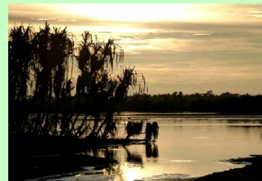
Senja di Rawa Vreinscap oleh Gatot Nugroho, BPK Manokwari