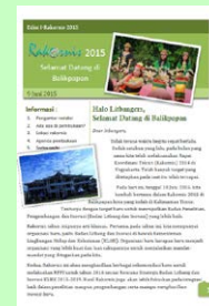
Berita Rakornis Edisi I, 2015