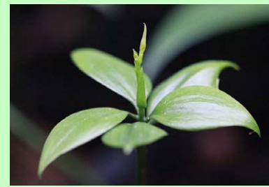
Agathis di Aek Nauli oleh Ahmad Dany Sunandar, BPK Aek Nauli

Sintesa Hasil Penelitian Pengelolaan Hutan Alam Produksi Lestari