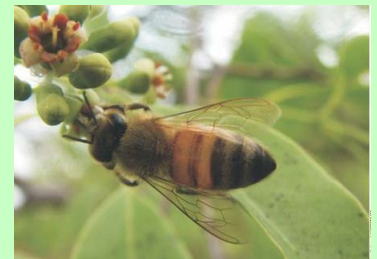
Pollinator/agen penyerbuk utama jenis Cendana oleh B2PBPTH Yogyakarta