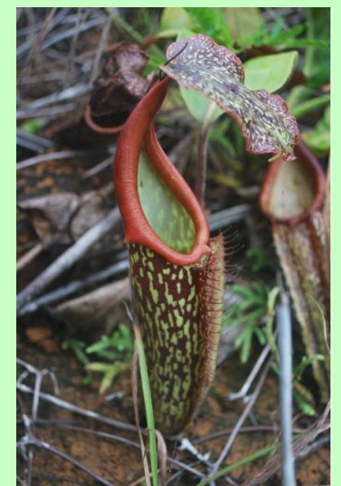
Kantong semar oleh Arin (BPK Manado)