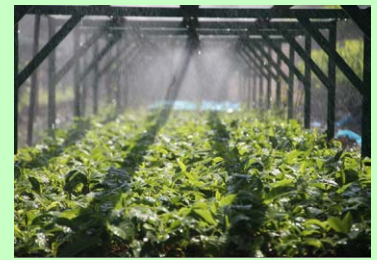
Geliat Kehidupan Baru di Persemaian oleh Choirul Akhmad (BPK Palembang)