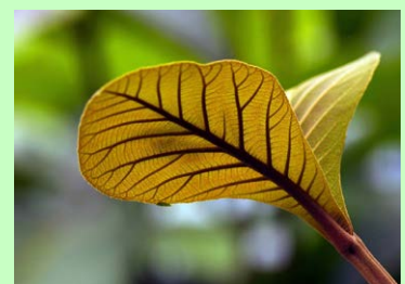
Daun Muda dari Kebun Pangkas oleh Jaka Suryanta (KFF)