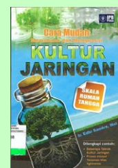
Cara Mudah Memahami dan Menguasai Kultur Jaringan skala rumah tangga