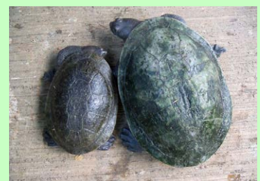
Dua Sejoli dari Rote oleh Kayat (BPK Kupang)