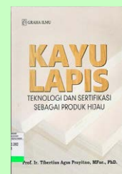
Kayu Lapis Teknologi Dan Sertifikasi Sebagai Produk Hijau