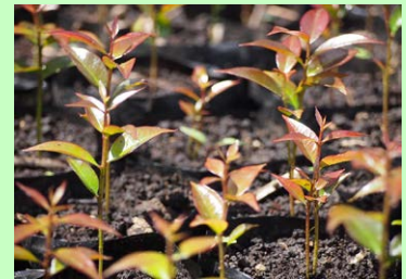
The Motion Growth of Nyampuh ( Litsea diversifolia ) oleh Kris Sugiyanto KFF