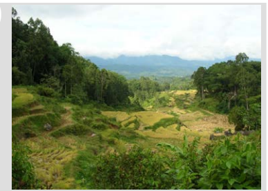
Landscape Tana Toraja oleh Priyo Kusumedi