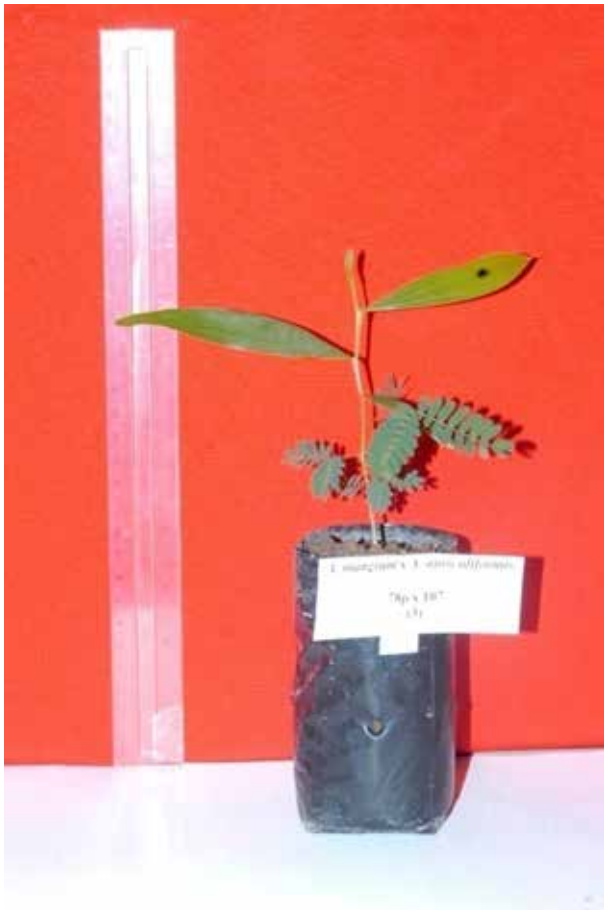
Gambar 2. Semai hibrid Acacia umur 7 minggu ( A. mangium x A. auriculiformis ) dengan susunan taksonomi daun : 1 daun sejati pertama ( once pinnate ), 2 daun sejati kedua ( bi-pinnate ) dan 1 daun sejati ketiga ( phyllode + bi-pinnate ), 2 daun semu ( phyllode )