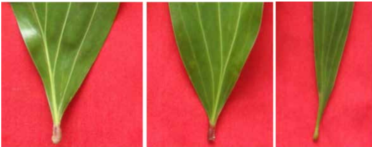
Gambar 8. Pangkal daun semu ( phyllode ) semai A. mangium (A), hibrid Acacia ( A. mangium x A. auriculiformis ) (B) dan A. auriculiformis (C)