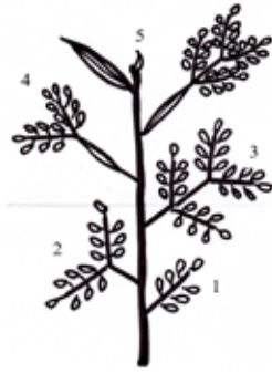
Gambar 1. Susunan perkembangan daun semai: Once-pinnate (1), bi pinnate (2), 4-pinnate (3) phyllode + 2-pinnate (4), phyllode + 4-pinnate pinnate (5) phyllode

Hasil pengamatan terhadap karakter morfologi daun dan perkembangan bentuk pada semai hibrid Acacia ( A. mangium x A. auriculiformis ) disajikan dalam Tabel 3 dan Gambar 2-8.