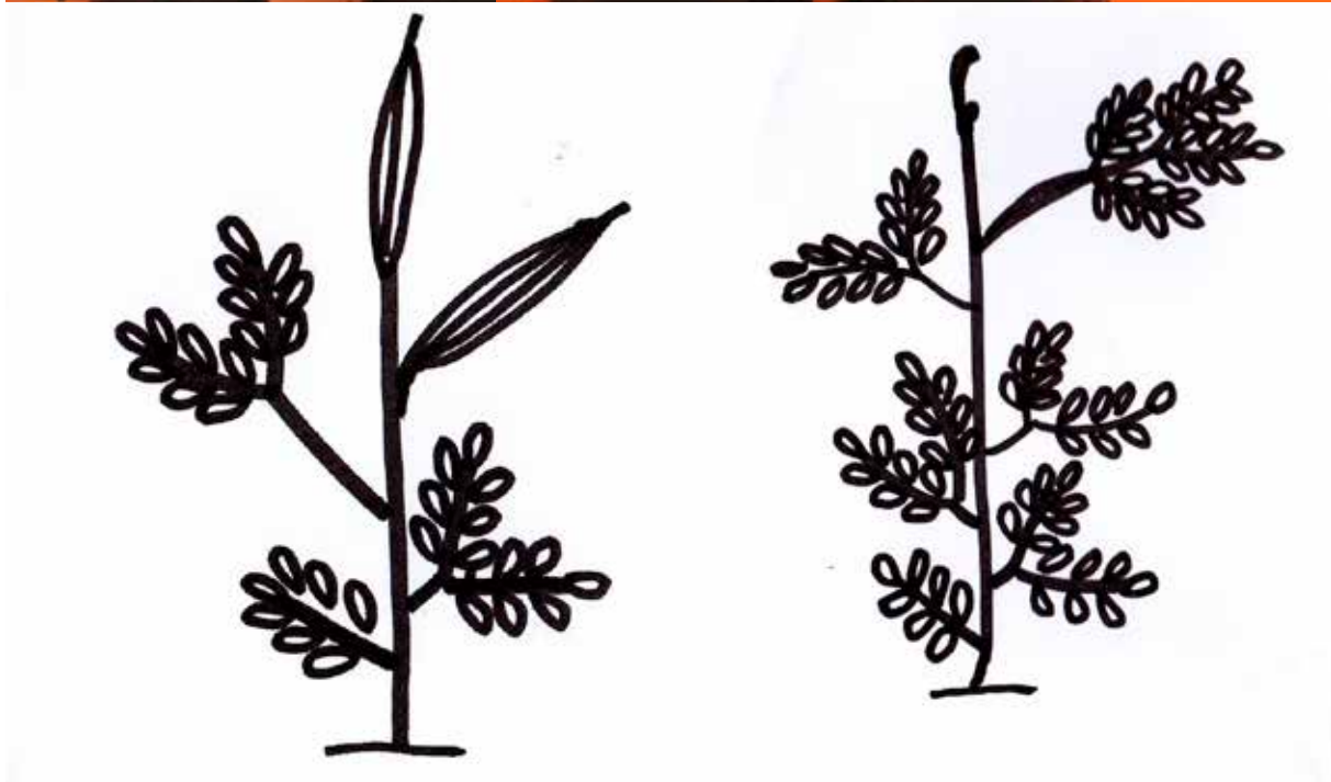
Gambar 3. Semai Acacia auriculiformis (A) umur 6 minggu dengan susunan taksonomi daun : 1 daun sejati pertama ( once pinnate ), 1 daun sejati kedua ( bi-pinnate ), 1 daun sejati ketiga ( phyllochia + bi-pinnate ) dan daun semu ( phylloide ) serta semai A. mangium (B) umur umur 6 minggu dengan susunan taksonomi daun : 1 daun sejati pertama ( once pinnate ), 4 daun sejati kedua ( bi-pinnate ), 1 daun sejati ketiga ( phylloide + 4-pinnate ) dan calon daun sejati keempat