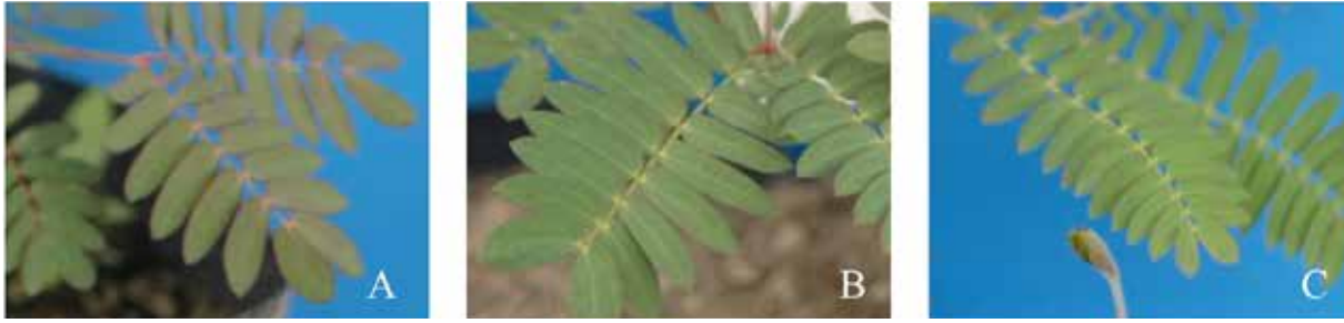
Gambar 4. Warna bagian atas anak daun sejati semai A. mangium (A), hibrid Acacia ( A. mangium x A. auriculiformis ) dan A. auriculiformis