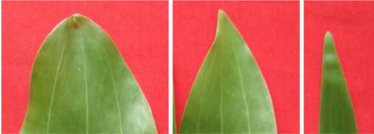
Gambar 7. Ujung daun semu ( phyllode ) semai A. mangium (A), hibrid Acacia ( A. mangium x A. auriculiformis ) (B) dan A. auriculiformis (C)