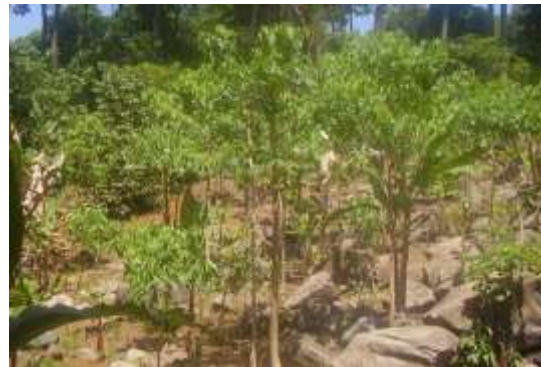
Gambar (Figure) 2. Tanaman G. arborea berumur 1 tahun ( G. arborea trees at one year old )

Hasil penelitian menunjukkan tanaman gmelina dapat tumbuh baik di lokasi penelitian (Gambar 2 dan Gambar 3).