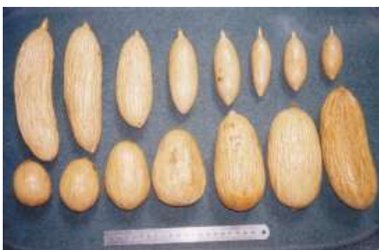
Gambar (Figure) 4. Karakteristik biji ulin ( The characteristic of ulin seeds )

diperoleh sebagai hasil dari penelitian ini antara lain adalah ukuran batang yang sangat besar, yakni bergaris tengah (pada setinggi dada) hingga 247 cm dan ukuran biji yang lebih panjang, yakni hingga mencapai 20 cm, tepatnya dengan panjang 5,5-20 cm dan garis tengah 2,6-7,2 cm (Gambar 4). Informasi sebelumnya (Soerianegara & Lemmens, 1993) menyebutkan bahwa ukuran terbesar dari batang ulin adalah dengan garis tengah 220 cm, sedangkan untuk biji, ukuran terpanjang adalah 16 cm. Kedua informasi terbaru tersebut diperoleh dari pohon ulin yang terdapat di dalam kawasan Taman Nasional Kutai, Kalimantan Timur.