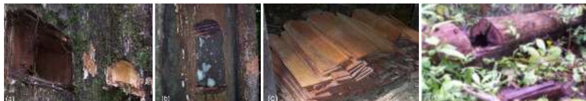
Gambar (Figure) 5. Proses pembuatan sirap yang didahului dengan pengambilan contoh kayu dengan cara mengoak pohon ulin yang masih berdiri atau yang sudah ditebang ( Wooden roof making processing by collecting wood samples from a standing or felled trees )

Berdasarkan pengamatan langsung di lapangan, maka dapat dikatakan bahwa ulin secara umum hanya dijumpai secara alami pada tempat-tempat yang kondisi vegetasinya masih cukup baik. Dengan kata lain, ulin hampir tidak pernah dijumpai pada habitat yang hutan atau vegetasinya pernah mengalami kerusakan berat, terutama karena kebakaran yang berulang-ulang atau telah mengalami bentuk pemanfaatan (konversi) yang berotasi sebagai lahan pertanian (ladang) berpindah. Seperti disajikan pada Tabel 1, keanekaragaman spesies pohon pada tegakan hutan yang didominasi oleh ulin cukup tinggi. Terutama di Setulang, hanya dalam petak cuplikan seluas 0,92 ha terdapat sebanyak 175 spesies, di mana jumlah tersebut termasuk ke dalam 103 marga dan 45 suku. Jumlah spesies yang dijumpai di PT ITCI, Sepaku tampak paling sedikit, yakni hanya 84 spesies. Hal ini mungkin karena luas petak cuplikannya yang sangat kecil atau karena kondisi habitatnya yang memang tampak lebih rusak akibat kegiatan penebangan pada beberapa tahun silam.