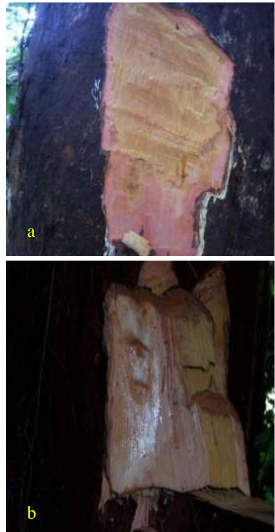
Gambar (Figure) 3. Kulit bagian dalam ulin yang kering dan sulit dikupas (a) dan kulit dalam yang berair dan mudah dikupas (b) (The dry and difficult to peel of inner bark (a) and the watery and easy to peel of inner bark (b) of ulin)

dipisahkan dari bagian kayunya (sulit dikupas), karena bersifat kering. Sebaliknya pada var. xx (yang oleh masyarakat Setulang dikenal dengan nama ‘ulin tikus’) memiliki kulit yang mudah dikupas yang mungkin disebabkan oleh sifatnya yang basah. Selain itu, masyarakat juga mengenal ulin tikus dari kayunya yang kurang awet, ringan serta terapung apabila dimasukkan ke dalam air. Penampakan kulit bagian dalam yang kering dan basah tersebut pada ulin disajikan pada Gambar 3.