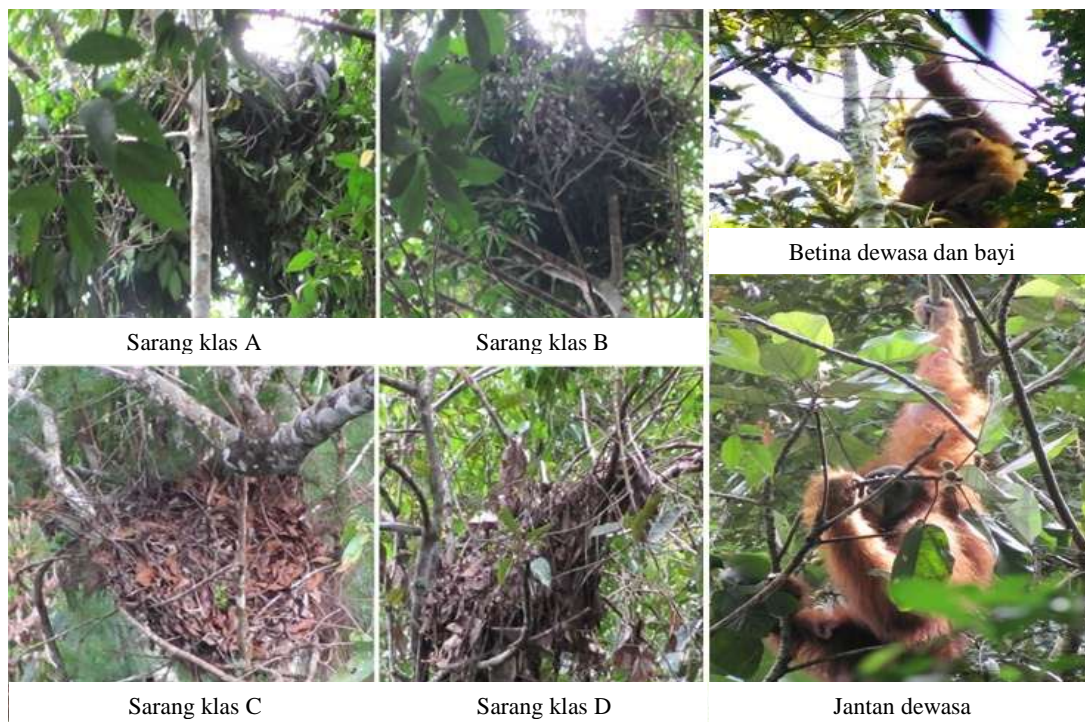
Gambar (Figure) 3. Deskripsi klas sarang dan orangutan di sekitar CA Sipirok ( Description of nests age and orangutan around Sipirok Nature Reserve )

Kepadatan populasi orangutan di CA Sipirok termasuk kategori rendah (0,47 individu/km 2 ) dengan kondisi sebagian habitat telah mengalami kerusakan/fragmentasi, seperti ditemukannya area semak belukar. Selain itu, perambahan masih terjadi terutama di sekitar enklave Batahan yang lokasinya ada di tengah-tengah kawasan. Konflik dengan manusia pun terjadi terutama ketika musim buah durian karena beberapa kawasan berbatasan langsung dengan lahan olahan masyarakat dan akibatnya orangutan akan mudah ditangkap.